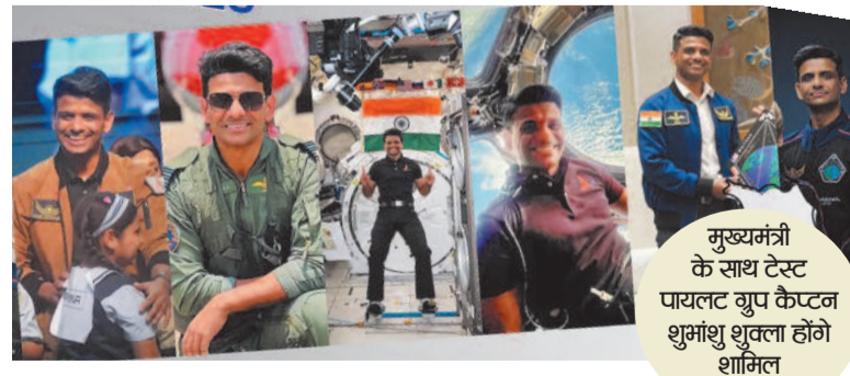
मुख्यमंत्री के साथ टैट पालट ग्रुप कैप्टन शुभांशु शुक्ला होंगे शामिल

रायपुर। छत्तीसगढ़ के शैक्षिक और वैज्ञानिक क्षेत्र में एक नई अंतरिक्ष क्रांति की शुरुआत होने जा रही है। अंतरिक्ष यात्री पहली बार छत्तीसगढ़ आ रहे हैं। जिला प्रशासन रायपुर एवं आईडीवायएम फाउंडेशन द्वारा, सारडा एनर्जी एंड मिनरल्स लिमिटेड के सहयोग से "प्रोजेक्ट अंतरिक्ष संगवारी" का शुभारंभ किया जा रहा है। इस महत्वाकांक्षी परियोजना के अंतर्गत नवा रायपुर में प्रदेश के पहले अत्याधुनिक अंतरिक्ष केंद्र की स्थापना की जा रही है, जिसका लोकार्पण 3 फरवरी को शासकीय उच्चतर माध्यमिक विद्यालय राखी नवा रायपुर में सुबह 10 बजे किया जाएगा। यह प्रोजेक्ट राज्य के विद्यार्थियों को अंतरिक्ष विज्ञान, उपग्रह तकनीक और आधुनिक स्पेस रिसर्च से सीधे जोड़ने की दिशा में एक ऐतिहासिक कदम माना जा रहा है। अंतरिक्ष केंद्र के माध्यम से विद्यार्थियों को न केवल सैद्धांतिक ज्ञान मिलेगा, बल्कि वे उपग्रह निर्माण, परीक्षण और संचालन की वास्तविक प्रक्रिया को भी नजदीक से समझ सकेंगे।