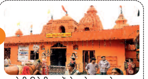
देशी-विदेशी फूलों से सजेगा महादेव ....