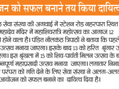
आयोजन को सफल बनाने तय किया दायित्व