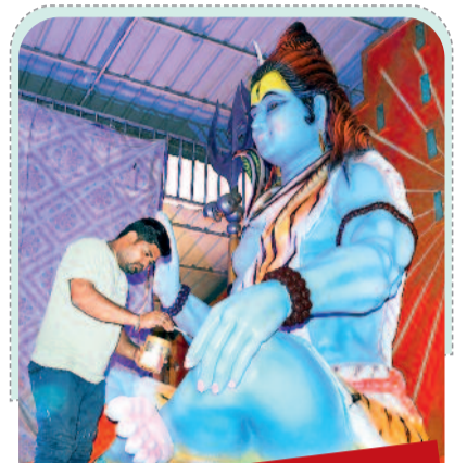
नरहरीश्वर महादेव का फूलों से सजेगा दरबार